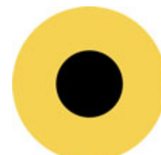
Inspiration til din ledelse