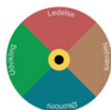
Ledelsesmodeller og -værktøjer